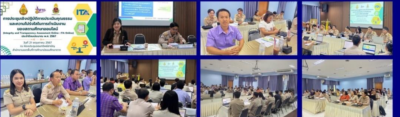
รายงานข่าวโดย ประชาสัมพันธ์โรงเรียนสรรพวิทยาคม สำนักงานเขตพื้นที่การศึกษามัธยมศึกษาตาก จังหวัดตาก ข่าว : นางสาวนพวรรณ ประชัน